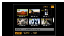
<サムネイル6枚表示>