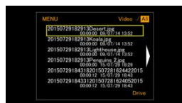
<テキストリスト表示>

※いずれの変更をしても、リストのファイルは、ファイルのフルパス名の順に並びます。