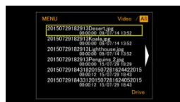
<テキストリスト表示>

※いずれの変更をしても、リストのファイルは、ファイルのフルパス名の順に並びます。