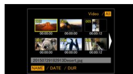
<サムネイル-6枚表示>